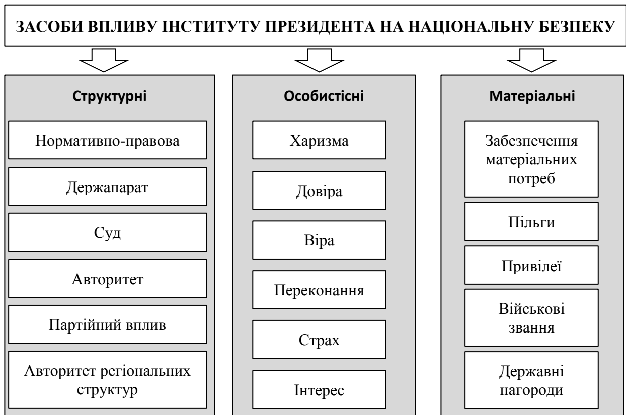
Рис. 1. Структура інструментів та засобів впливу інституту Президента на національну безпеку держави

Зміст, принципи та форми взаємовідносин інституту Президента і національної безпеки представляють різноманітність зв'язків, їх систему, тенденції, стратегічні цілі, визначають вплив на політичний курс, соціально-економічне становище, культуру, гуманітарні й світоглядні аспекти, інноваційний характер прийняття державно-управлінських рішень [8, с. 1].