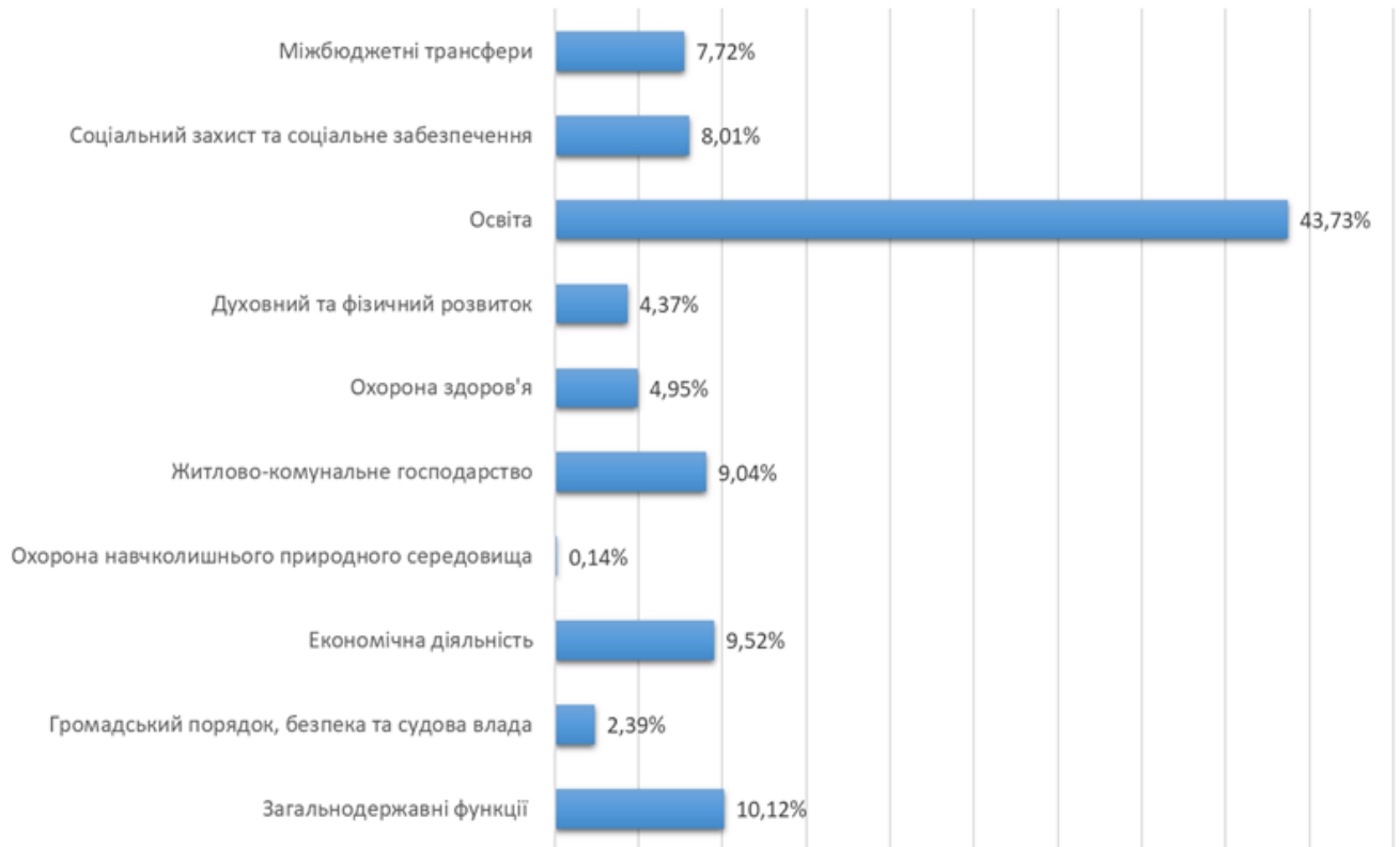
Рис. 2. Структура бюджету громад за видатками разом

впровадження цифрових рішень, і найбільша частка видатків місцевих бюджетів спрямовується на сферу освіти, тоді як найменші обсяги фінансування припадають на охорону навколишнього природного середовища (рис.2).